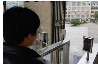
Cladiri comerciale, de birou, comunitare