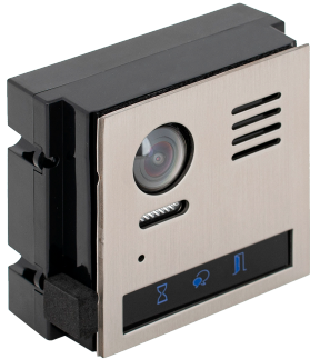
Modul video DT821{VD}