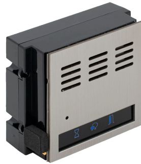
Modul audio DT821{AD}