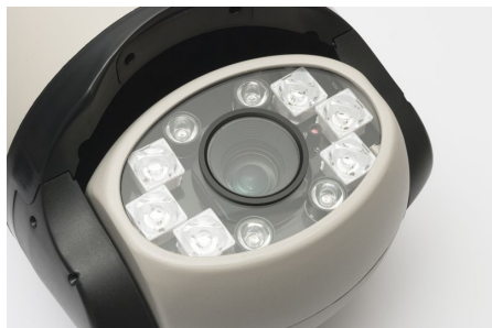
Iluminator IR 150m, sincronizat cu modulul optic